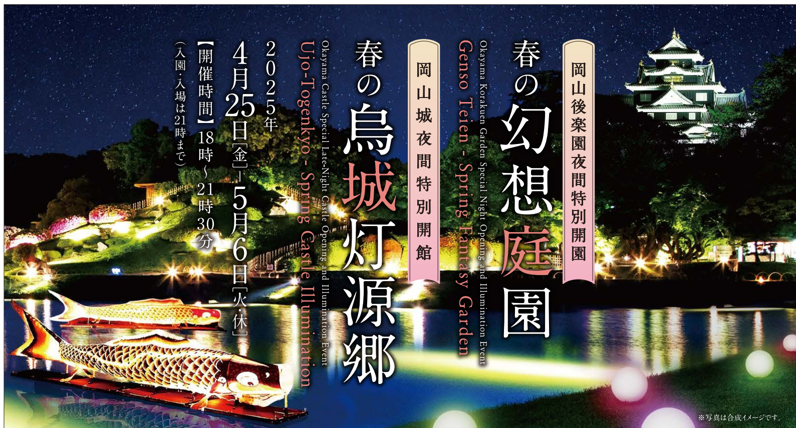
※写真は合成イメージです。