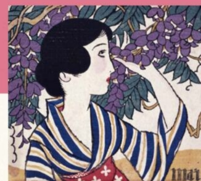
『婦人グラフ』第3巻第5号表紙