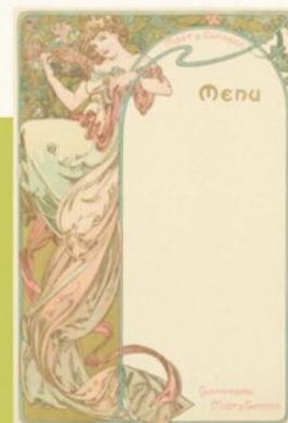
《メニュー:モエ・エ・シャンドン》1899年