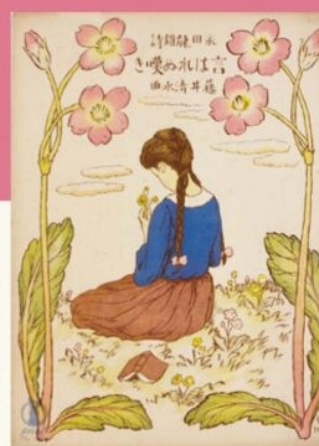
『セノオ楽譜「言はれぬ唄」』