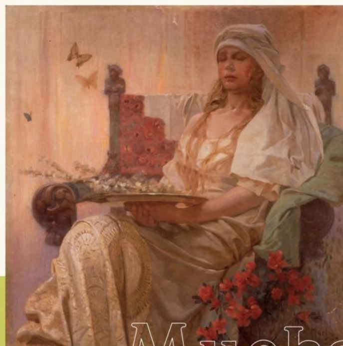
《目を閉じた少女》1920年頃