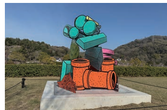
※作品イメージです

un14-2 NEW 金氏徹平「Model of Something」 パスポート対象 個別鑑賞料なし